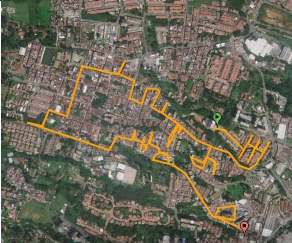
Figura 3. Macrorruta La Estrella Viernes– Horario: viernes a partir de las 7:30 a 1:00 pm